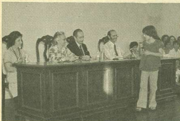
A Criança e o Jovem, na FEB, têm prioridade

E M NOVEMBRO DE 1977, "Reformador" estampou noticiário (p. 331) referente ao lançamento da Campanha em foco, na Federação Espírita Brasileira, no Rio de Janeiro (RJ), adiantando que trabalho semelhante tinha lugar no mesmo dia 9-10-1977 em todo o país. ➔