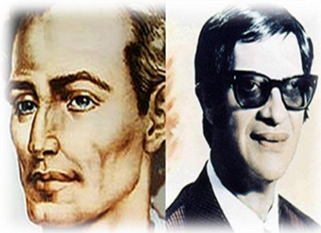
Emmanuel/Francisco Cândido Xavier

O companheiro valoroso do Cristo, contudo, não se esqueceu de afirmar que isso é trabalho para os de duplo ânimo, porque semelhante renovação jamais se fará tão-somente à custa de palavras brilhantes.