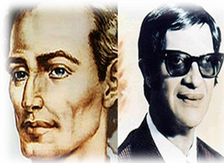
Emmanuel/Francisco Cândido Xavier