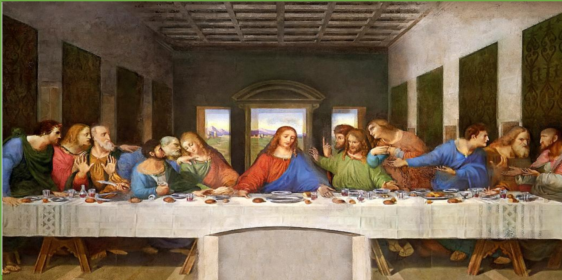
Leonardo da Vinci (1452-1519) Igreja e Convento Santa Maria Delle Grazie, em Milão, Itália.